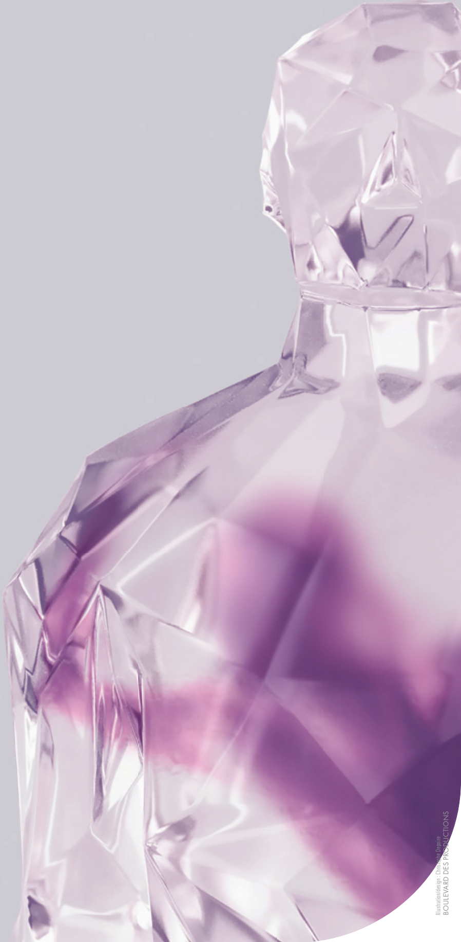
Illustration design: Cécile de Jougla BOULEVARD DES PRODUCTIONS

Forum Européen de Bioéthique bioethics_forum @FEBioethique live-tweet : #febs #FEBioethique